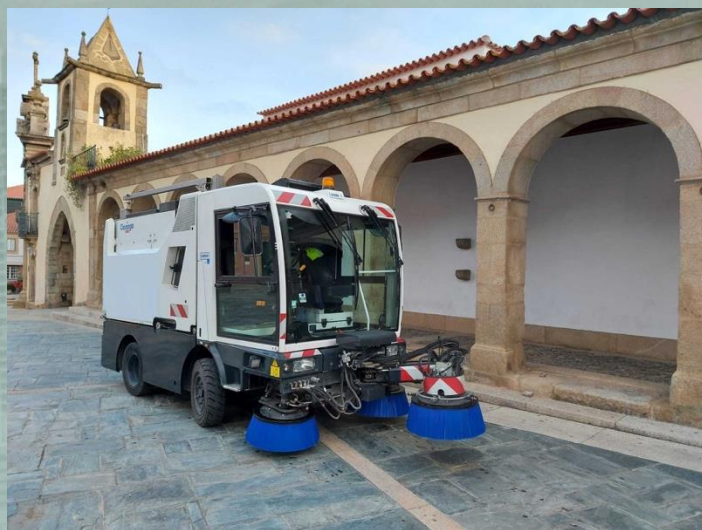
Barredora de calle

Costo total del proyecto: $93,000.00 aprox