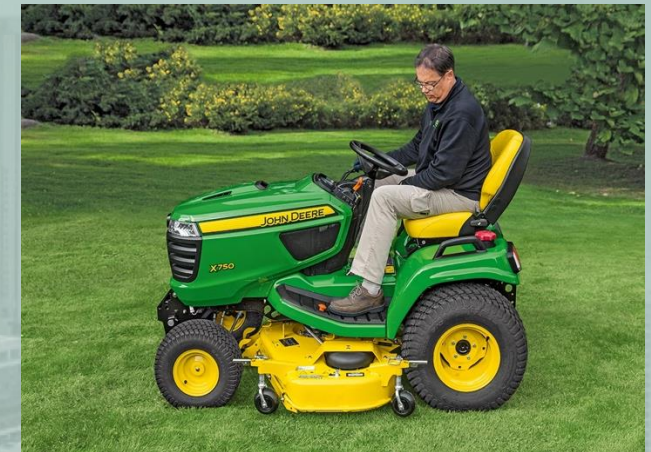
Carro de poda